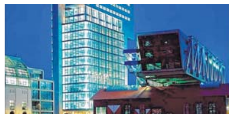
Das Port Event Center (rechts), auch als Wolkenhügel bezeichnet, ist für 22,3 Millionen Euro verkauft worden.