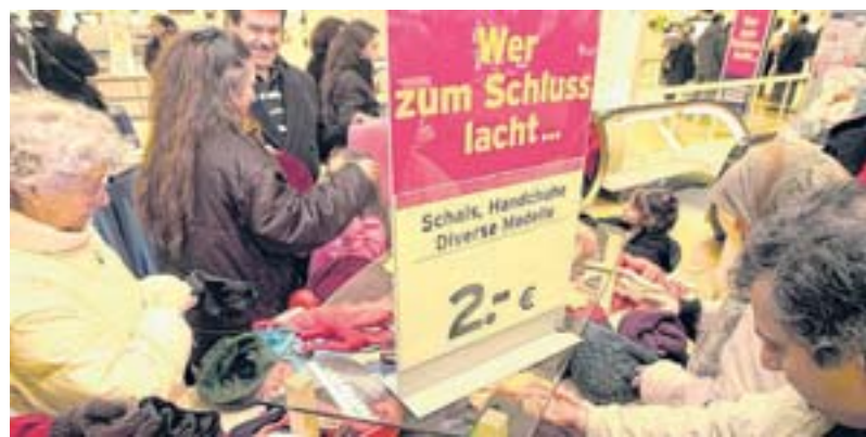
Der Winterschlussverkauf soll offiziell am 24. Januar starten. Bei vielen Händlern sind Handschuhe oder Skihosen aber bereits ausverkauft.